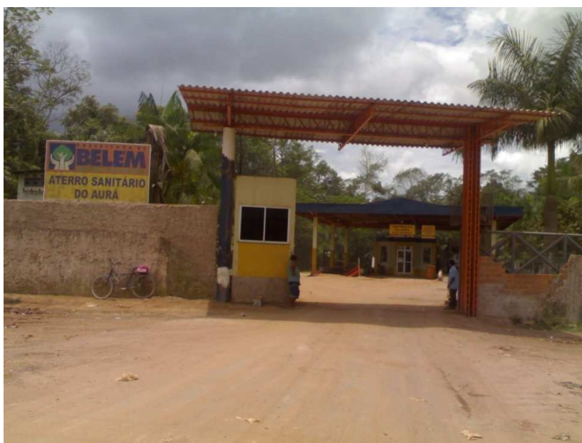
Figura 2: Acesso ao Aterro Sanitário do Aurá

Sendo assim, diante de todos estes problemas na APA, no Aterro Sanitário do Aurá e nas comunidades em seu entorno, há uma necessidade clara de que novas alternativas sejam viabilizadas para solucionar estes conflitos. Podemos observar a entrada de acesso do Aterro Sanitário do Aurá, conforme mostra a Figura 2, abaixo.